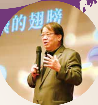
朱宗慶的風範與談吐，讓「大師講座」全程掌聲、笑聲、讚嘆聲不斷。

知名音樂家朱宗慶日前現身臺北榮總「大師講座」，以「千山萬水擋不住想飛的翅膀」為題，分享臺灣文化底蘊之美的故事，大師的風範和談吐，讓現場和線上聆聽的北榮同仁如醉如痴，獲益良多。