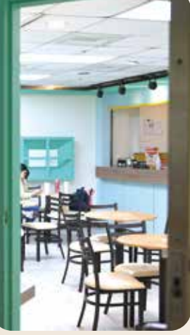
「靜耘坊」由北榮附設庇護工場一群身心障礙者經營，提供的餐點非常平價，雞絲麵是陳威明院長的最愛。

陳院長也致力提升醫院環境品質，其中包括綠美化工程。從副院長到院長，七年來在他推動及各界贊助協力下，為北榮種植了數萬株花卉與樹木，使整個醫院宛如都會大公園，成為一個充滿生機和人文關懷的療癒之地。