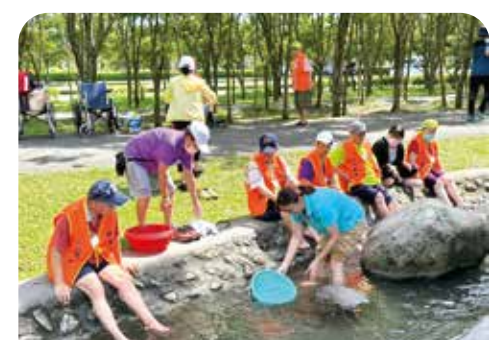
屏東榮家長輩們於森林園區內小溪泡脚，舒爽身心。

【連線報導】秋高氣爽，榮家紛紛微旅行，讓住民長輩享受輕鬆的遊覽，身心健康快樂。 雲林榮家帶領住民長輩參觀嘉義老楊方塊酥觀光工廠，方塊酥是嘉義人的最愛，觀光工廠介紹方塊酥的歷史，戶外廣場有古錐造景、大型彩繪建築、消暑噴泉及全新打造的夢幻球池，還有唯美的玻璃咖啡館，住民長輩拍照、試吃及採購精美的伴手禮。接著參觀位於嘉義縣民雄鄉的嘉義酒廠，住民長輩由此了解該酒廠擁有的「九品蓮花生態教育園區」。