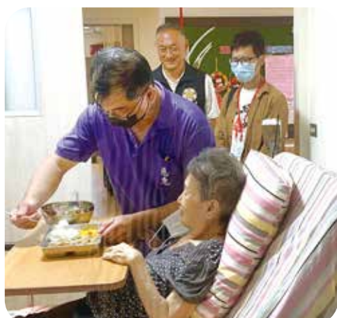
蔡媽媽現在由臺南榮家專人照顧，令蔡姓軍官不再煩惱。

【本刊訊】關西二〇六旅作戰科蔡姓軍官的母親，住在臺南市新化區，最近老人家病重，唯一的姊姊照顧不了，令他很煩惱，後來查知臺南榮家新建家區完成，並同意協助，蔡媽媽於是住進該榮家養護區，由專人照顧，解決了他的問題，可以安心於軍旅工作。 蔡媽媽有糖尿病、心臟病、高血壓病史，今年三月因頭暈暈倒，造成腦內出血後失能，行動不便，他姊姊一人照顧不了，他又遠在新竹的部隊，無法幫忙，真是蠟燭兩頭燒，十分煩惱。後來他透過臺南榮家官網得知該榮家新建家區完成，便積極了解床位資訊及申請程序，日前，蔡媽媽由家人及臺南榮家協助，入住該榮家養護區，很快適應，更常以「微笑」回報工作人員，對榮家的照顧十分肯定及讚許。 由於榮家的協助，蔡媽媽的生活大幅改善，現在，她不再擔心自己在家跌倒，兒子可以全心全意在軍旅生活中實現夢想。 現在蔡姓軍官休假時，便到臺南榮家探視母親，其他的親友也會相約於假期時在榮家會面，一起陪伴蔡媽媽話家常。