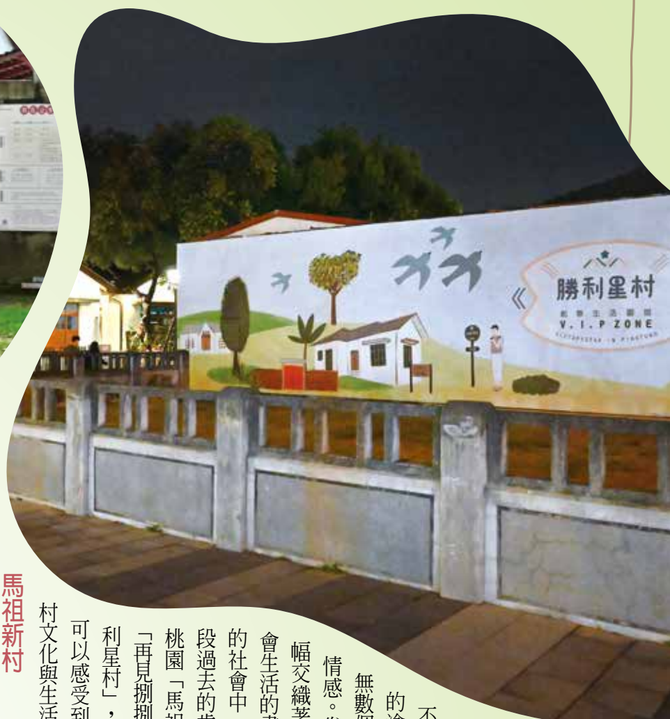
▲勝利星村創意生活園區保存規模最大、數量最多、最完整的日式軍官宿舍建築群。