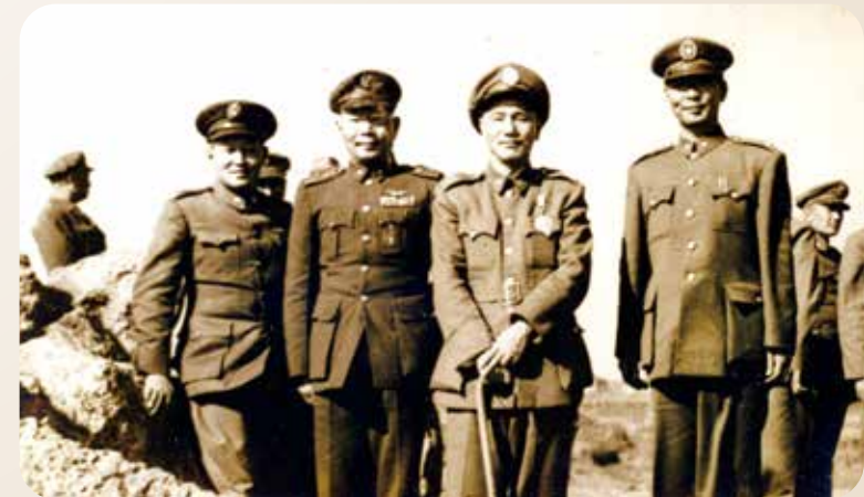
胡璉（前右一）、孫立人（前左一）戰後陪同蔣公（前右二）巡視金門。(圖／胡璉故居紀念館)

胡璉（前右一）、孫立人（前左一）戰後陪同蔣公（前右二）巡視金門。(圖／胡璉故居紀念館) 爺爺，受訪時回憶民國三十八年那場古寧頭戰役，依然歷歷在目。他是胡璉兵團十八軍一八師三五三團二營五連的二等兵，軍長是高魁元，師長是李樹蘭。十月初於汕頭搭中上字號登陸艦，自金門料羅灣上岸，在頂堡接受訓練。十月二十五日凌晨，突然砲聲轟鳴，一八師三五三團緊急集合，分三路直奔火線，黑暗中與敵人交錯而過，共軍先開槍，藍玉璋身旁的堂弟藍湧榮應聲倒地，藍玉璋右腿也被子彈擦傷。天亮後，排長石少卿中槍身亡，隨後戰車來援，藍玉璋和弟兄隨戰車在北山和三營會合。激戰至晚，共軍利用夜暗向北突圍至海邊，此役三五三團犧牲慘重，但也贏得輝煌戰果。戰後，一八師獲頒榮譽虎旗一面，被稱為「虎軍」。