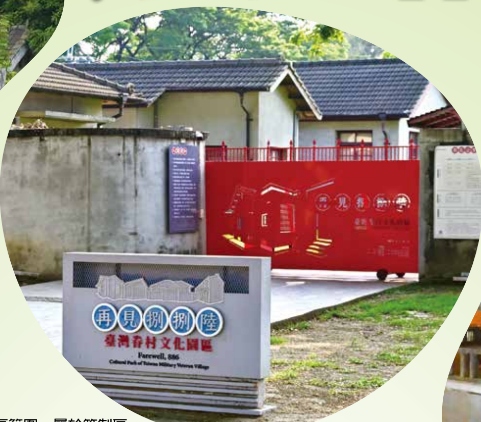
▲左營有許多眷村被規劃在軍區範圍，屬於管制區。