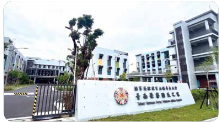
全新建造的臺南榮家外觀，顏色活潑明亮，為榮家注入活力。

臺南榮家暨臺南市榮服處新建工程，榮獲今年建築園冶獎。臺南榮家與臺南市榮服處共享殊榮。