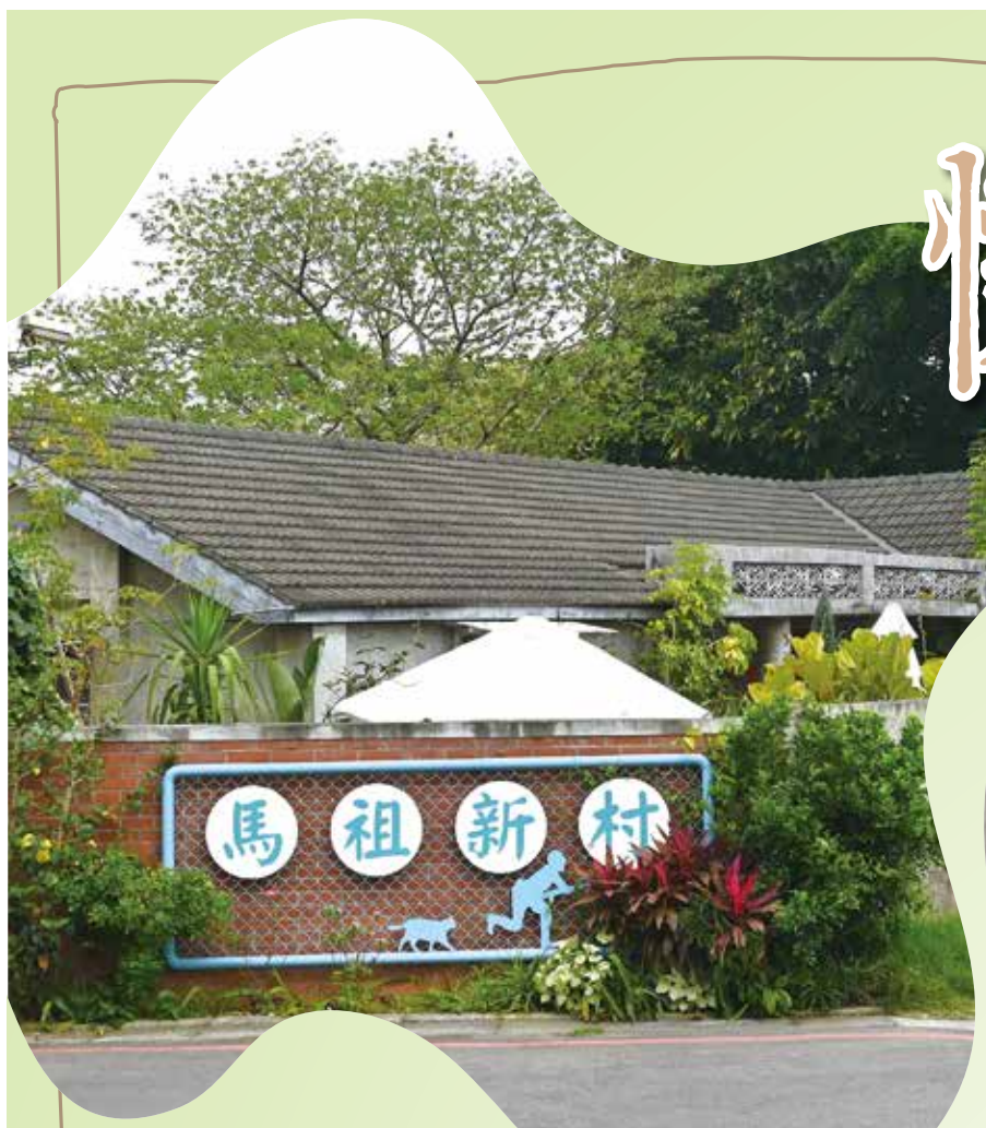
▲馬祖新村是眷村文化保存運動中相當重要的地區。