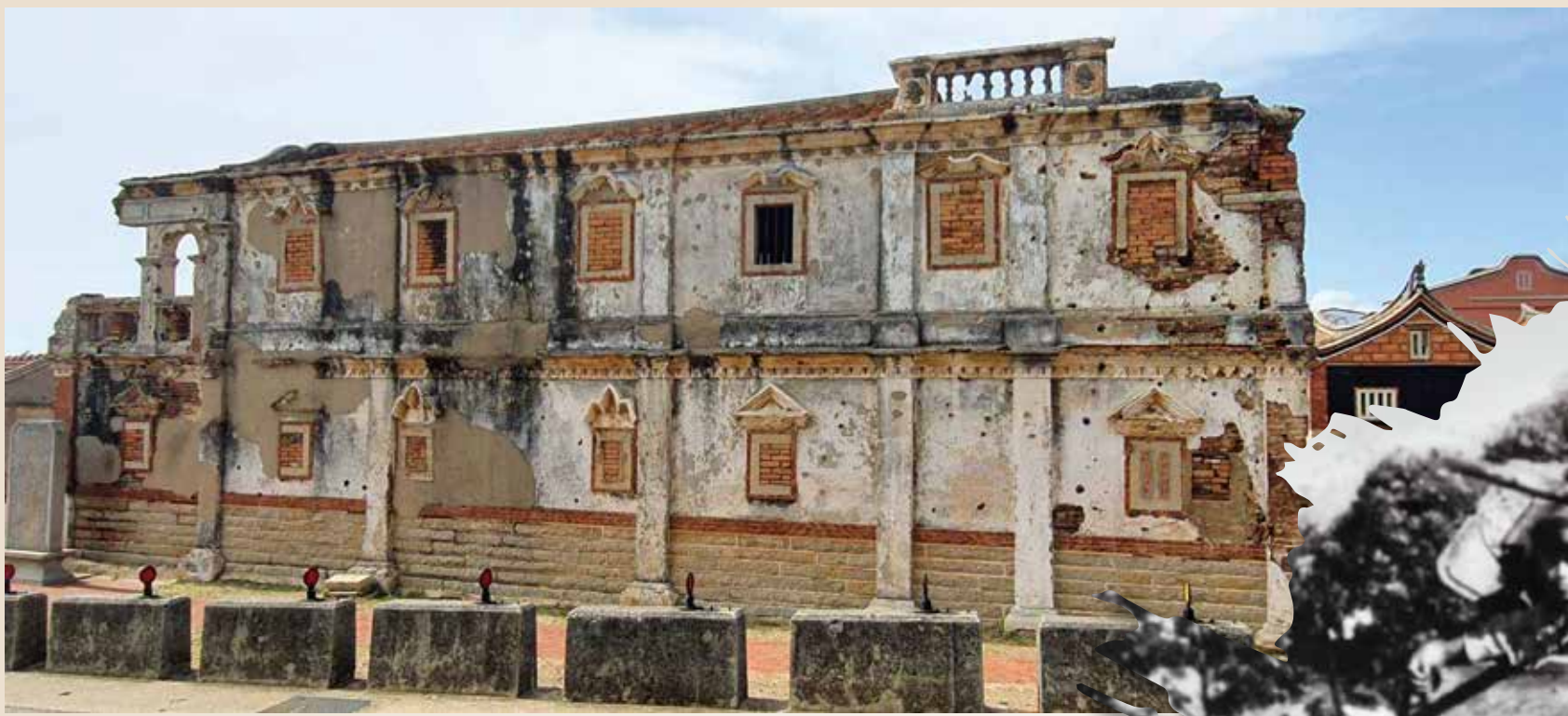
◀北山古洋樓彈痕累累，怵目驚心，可以想見當年戰場的慘烈景象。