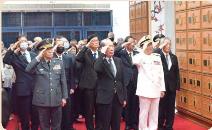
▲主祭官陳鎮湘上將(前排中)偕陪祭者、與祭者向龕位行禮致敬。

上午十時舉行安奉儀禮，靈堂敬置陳體端上將的軍裝遺照，旁邊陳列賴清德總統、行政院長卓榮泰頒發的「旌忠狀」。主祭官陳鎮湘上將率陪祭官等共同致祭，獻花、恭讀安奉文，行三鞠躬禮，儀隊則行舉槍禮；家屬答禮後，全體至四樓龕位