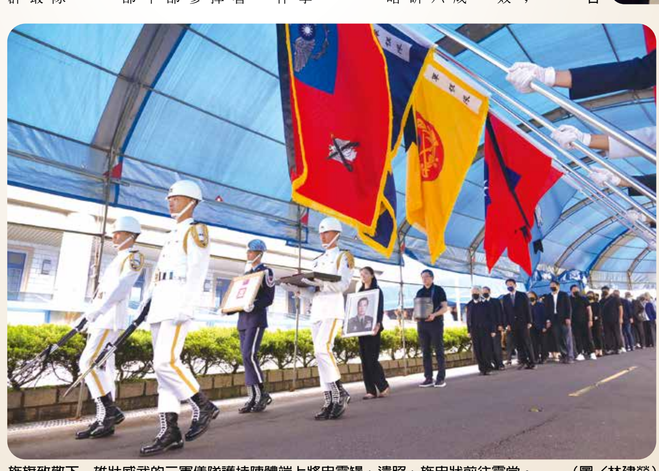
旌旗致敬下，雄壯威武的三軍儀隊護持陳體端上將忠靈轎、遺照、旌忠狀前往靈堂。

動績彪炳 千秋長昭 至接掌後備司令部後，他以「強化團結安定」、「貫徹本務工作」、「落實依法行政」為治軍理念；因應國軍「常後分立」組織調整與「常備打擊、後備守土」的戰略構想，結合「守土」作戰任務，積極強化後備部隊動員戰備整備與新訓任務，以及後備軍人的照顧服務工作，以達成保家、保鄉、保國與保產的任務，功不可沒。 九十四年六月一日，陳將軍轉任總統府戰略顧問，一〇一年六月一日退伍，軍旅期間動績卓著，榮獲三等寶鼎、三等雲麾、三星忠勤等勳獎章三十餘座。