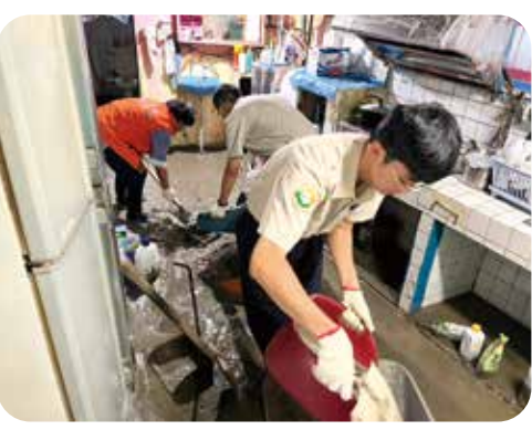
屏東縣內埔鄉獨居遺眷丁女士住處周邊林木傾倒折斷，極需整理，經屏東縣榮服處同仁前往協助，鋸樹枝、清積水、收拾垃圾，遺眷也捲起衣袖打掃，幾經忙碌，家園逐漸復原，遺眷頻頻感謝協助，現場充滿溫馨。