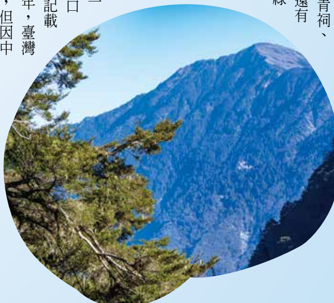
臺東端的南橫公路，山景巍巍。