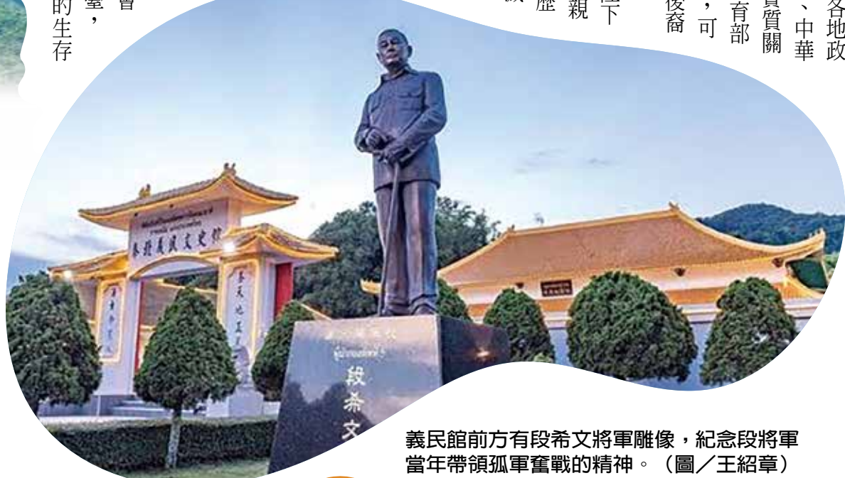
義民館前方有段希文將軍雕像，紀念段將軍當年帶領孤軍奮戰的精神。（圖／王紹章）

當年孤軍領袖段希文將軍為維繫中華文化，在百般艱難之中毅然建立興華中學，各村寨也紛紛建立華文學校，改變無數孤軍後裔的命運；另外，引進臺茶，讓鄉親們擁有資以謀生的作物；還有李登良先生的美斯樂引水工程；創立雲南會館，建立與外界聯繫的平臺，在在都影響著臺北孤軍的生存與發展。