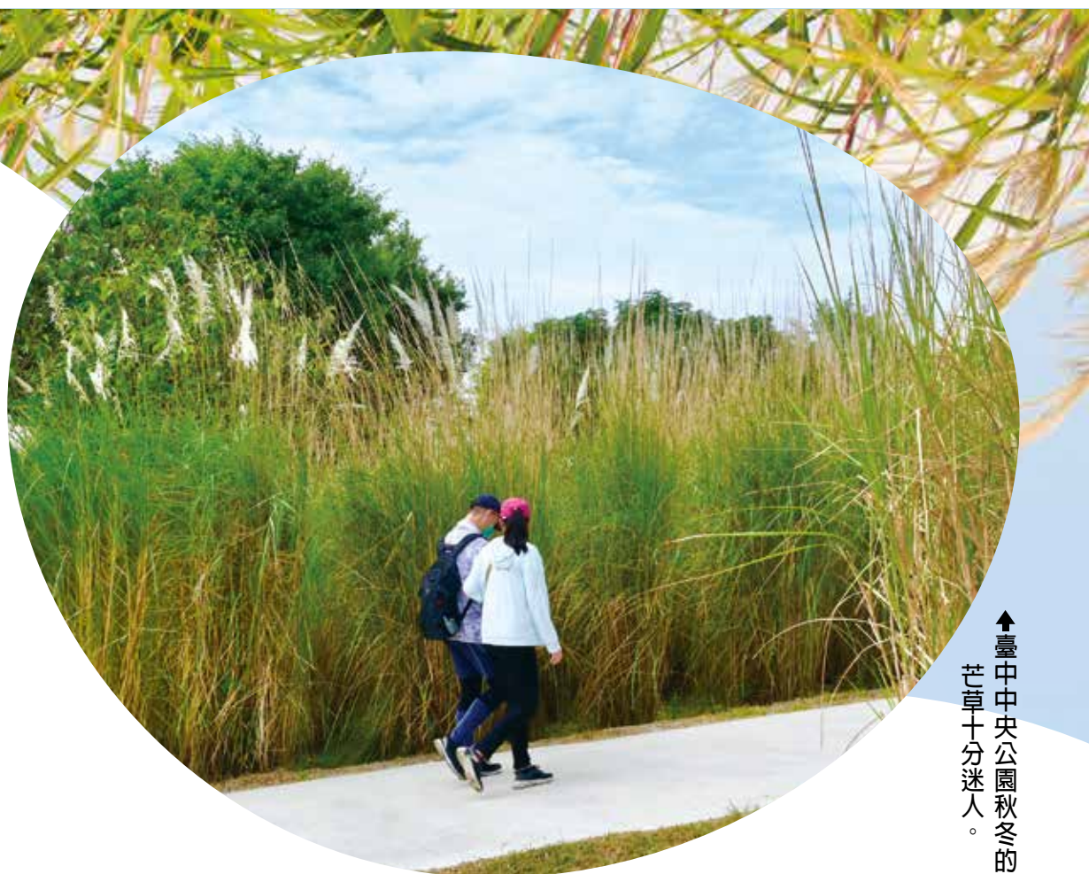
▲臺中央公園秋冬的芒草十分迷人。