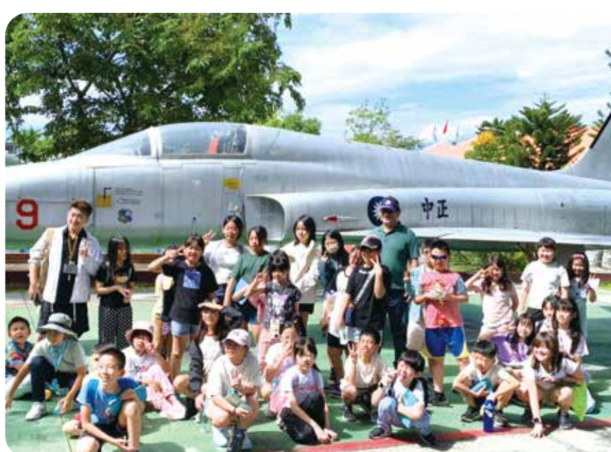
臺北市大安國小師生於陳展的F-5E戰機前合影，留下快樂的回憶。