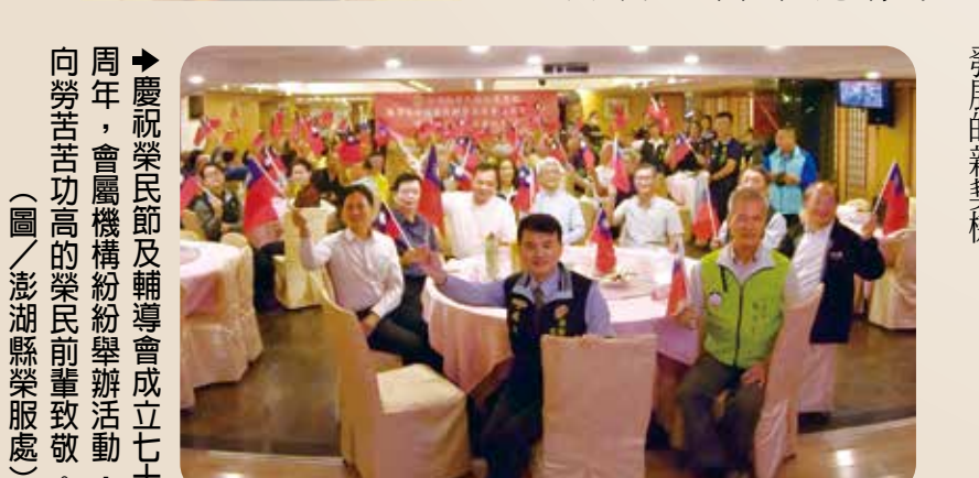
慶祝榮民節及輔導會成立七十周年，會場機構紛紛舉辦活動，向榮光高功的榮民前輩致敬。