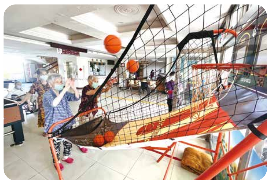
岡山榮家一群奶奶在投籃機前投籃競賽，活動筋骨兼聯誼。