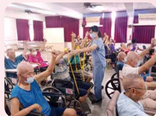
肩關節伸直運動。