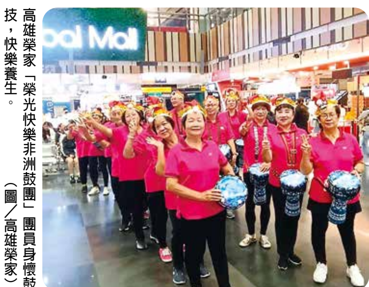
高雄榮家「榮光快樂非洲鼓團」團員身懷鼓技，快樂養生。

【本刊訊】耶誕節將至，位於臺鐵新左營站的環球購物中心邀請高雄榮家「榮光快樂非洲鼓團」，為耶誕點燈儀式熱鬧開場，只見鼓團以《聖誕狂歡歌》、《踏浪》等樂曲開場，熱鬧歡欣的旋律及強勁的鼓聲帶來蓬勃活力，觀眾們給予熱烈掌聲。 這個由榮家住民長輩組成的樂齡社團，經卓著教育公司韓韓老師每週一次的教導，藉由流行音樂旋律練習節拍技巧，長輩們還結合體適能設計肢體律動，達到歡樂有趣、快樂舒暢的養生目的。 團員們有些擅長書法、舞蹈、攝影及園藝等專長，其中八十八歲優雅動人的仲媽媽是鼓團更顯亮的團長；九十八歲仍身手矯健的祖爺爺更是高齡健康的指標人物！ 這場精彩熱鬧又充滿歡樂的演出，長輩們盡情展現熱情，吸引過往的旅客駐足欣賞，在同歡共樂的夜晚，感受溫馨歡樂的耶誕氛圍。