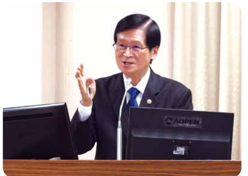
主任委員嚴德發強調，輔導會持續竭盡所能，積極爭取榮民福利。

【本刊訊】立法院第十一屆第二會期外交及國防委員會，十一月二十一日審查輔導會一一四年度預算，主任委員嚴德發列席報告施政重點及預算編列情形，強調輔導會持續積極爭取榮民福利，以感動服務落實對榮民(眷)及退除役官兵之照顧。 報告中指出，輔導會一一四年度預算，遵循行政院施政方針，通盤檢視現有施政計畫之優先順序及實施效益編成，歲入部分編列七億八千二百五十一萬一千九百九十九元，歲出部分編列一三〇億九千八百九十七萬七千元，希望立法委員全力支持，以利各項施政的推動。 輔導會報告的一一四年度施政重點包括：一、強化產學產訓合作，轉銜職場穩定就業；與國內大專校院、優質企業規劃「產學合作」課程，優化職業訓練中心教學環境及設施，主動與用人事業單位強化「產訓合作」培訓；二、強化尖端智慧精準醫療，推展三級醫養整合照護；各級榮院持續創新尖端醫療及預防保健，發展精準健康照護及智慧醫療；三、優化智慧照顧服務，營造祥和照顧環境；榮家持續推動「家庭化、社會化、智能化」目標，使榮民入住榮家能享受更好的生活品質；四、整合資源守護榮民，多元服務全日照顧；各地榮服處召開整合會議，擴大資源盤點運用與相互支援，協力解決問題；五、深化國際退輔交流，友好互訪鞏固盟誼；除現有美國及日本外，積極拓展與各友邦交流及凝聚榮僑向心力；六、縝密退除役給付作業，增進退除役服務效能；增加線上申請及查詢服務，提升簡政便民服務作業。