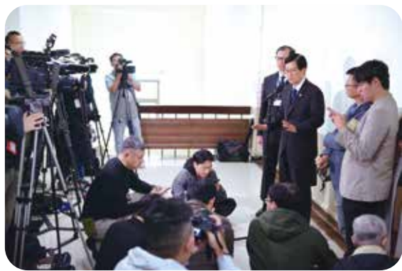
報告中強調，退輔工作關係國防建軍及社會安定甚鉅，輔導會將竭盡所能，盡力建構優質高齡醫療環境及照顧服務網絡，以完善退輔制度。輔導會主委嚴德發進入立法院外交及國防委員會前，接受媒體採訪。

【本刊訊】立法院第十一屆第二會期外交及國防委員會，十一月二十一日審查輔導會一一四年度預算，主任委員嚴德發列席報告施政重點及預算編列情形，強調輔導會持續積極爭取榮民福利，以感動服務落實對榮民(眷)及退除役官兵之照顧。 報告中指出，輔導會一一四年度預算，遵循行政院施政方針，通盤檢視現有施政計畫之優先順序及實施效益編成，歲入部分編列七億八千二百五十一萬一千九百九十九元，歲出部分編列一三〇億九千八百九十七萬七千元，希望立法委員全力支持，以利各項施政的推動。 輔導會報告的一一四年度施政重點包括：一、強化產學產訓合作，轉銜職場穩定就業；與國內大專校院、優質企業規劃「產學合作」課程，優化職業訓練中心教學環境及設施，主動與用人事業單位強化「產訓合作」培訓；二、強化尖端智慧精準醫療，推展三級醫養整合照護；各級榮院持續創新尖端醫療及預防保健，發展精準健康照護及智慧醫療；三、優化智慧照顧服務，營造祥和照顧環境；榮家持續推動「家庭化、社會化、智能化」目標，使榮民入住榮家能享受更好的生活品質；四、整合資源守護榮民，多元服務全日照顧；各地榮服處召開整合會議，擴大資源盤點運用與相互支援，協力解決問題；五、深化國際退輔交流，友好互訪鞏固盟誼；除現有美國及日本外，積極拓展與各友邦交流及凝聚榮僑向心力；六、縝密退除役給付作業，增進退除役服務效能；增加線上申請及查詢服務，提升簡政便民服務作業。