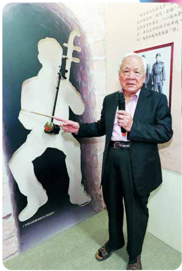
癡弦在「詩人癡弦特展」現身，指著曾使用的「胡」，向來賓介紹他的筆名由來。