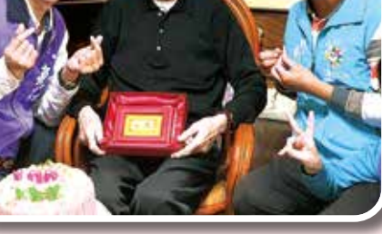
◆花蓮縣榮服處：童化夷爺爺心懷感恩，謙沖為懷。