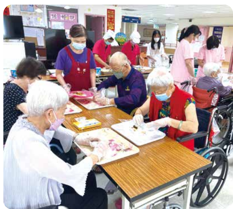
雲林榮家教長輩製作飯糰品嘗，活動筋骨，加強社交。

另外，臺北榮總桃園分院營養師教銀髮長者自製繽紛水果優格，首先將香蕉切片，奇異果、火龍果切丁，並將彩色早餐穀物裝盤備用，其中的威化夾心酥須切成三段。 之後將水果適量鋪在透明玻璃杯杯底，裝約半杯滿；加入優格，裝至杯子八分滿。然後鋪上藍莓與彩色早餐穀物，插上威化夾心酥即可食用。也可以再淋上藍莓果醬或蜂蜜，增添風味。 自製繽紛水果優格，視覺味覺雙重享受。