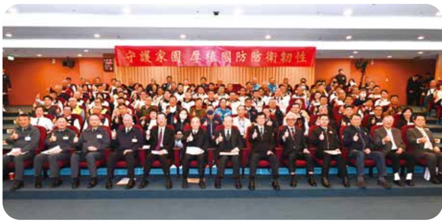
輔導會舉辦「115年愛國教育北區座談」，主委嚴德發呼籲榮民前輩發揮「衛國無悔」的精神。