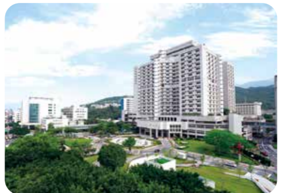
臺北榮總成績單背後，是「以病人為中心」的長期堅持。

【本刊訊】在競爭激烈的國際醫療舞臺上，輔導會各榮民醫院的醫療實力再次閃耀光芒。根據美國《新聞週刊》最新公布的「2026全球最佳醫院」排名，臺北榮總展現強大的成長韌性，在全球前二五〇強醫院中，從前年的第二一八名、去年的第二〇八名，今年一舉躍升至全球第一七四名，不僅穩居臺灣頂尖行列，更寫下持續突破的嶄新里程碑。 臺北榮總今年也進入前五〇強，全球排名第二四九名。 這是美國《新聞週刊》與全球數據公司 Statista 連續第八年合作，除了公布全球前二五〇強醫院，也發表各國當地醫院排名，國內三十五家接受評估的醫院中，臺北榮總名列第一，臺大醫院第二，臺中榮總第三，高雄榮