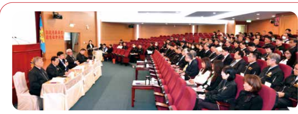
輔導會為成立「榮民照護數位轉型推動小組」，並於三月四日舉行第一次會議，主任委員嚴德發在會中宣示，今(一五)年七月，將舉行「榮民照護數位轉型元年」啟動儀式，完整呈現減少就醫、多重就醫及急診就醫次數等醫照整合試驗成果，作為國家高風險老人照顧模式的重要參考。

支持國防部」，尤其是近年來中共軍力不斷提升，面對日益嚴峻的威脅，我國必須堅實國防戰力，全體榮民前輩應與政府站在一起，共同支持國防建軍計畫。 國防安全研究院董事長霍守業指出，戰爭的最高境界在於「避免戰爭」，但在武力衝突難以完全排除的現實下，「善戰」與「備戰」才是和平的唯一籌碼，在關鍵時刻震懾對手、化解戰爭風險，達成「止戰」的終極目標。 國防部長顧立雄表示，正因榮民前輩們昔日的守護，國家才有今日的繁榮安定；面對中共威脅，國家更有義務提供先進的裝備，使國軍能專心戰備，無後顧之憂。國防部一定會以最嚴謹、透明的態度，審慎規劃每一分預算，精準地轉化成保家衛國的力量。 輔導會主委嚴德發總結指出，輔導會正積極整合社會資源，精進榮民就業、就醫、就學、就業等全方位照顧。針對國安議題，抱持守護國家的初心始終如一。面對嚴峻威脅，建立實力絕非口號，呼籲退伍軍人社團與榮民前輩發揮「衛國無悔」的精神，支持國防軍備規劃，共同成為國家安全的堅強後盾。