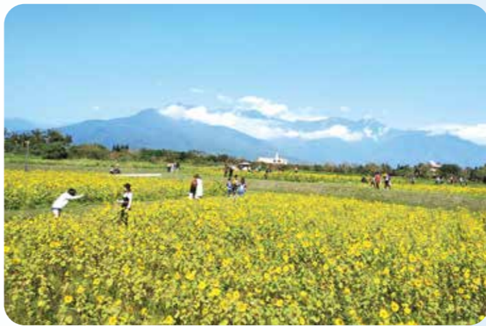
花東美景讓人心曠神怡。

隨著旅程南移，來到玉里鎮，絕對不能錯過知名的「玉里臭豆腐」。這道小吃之所以出名，是因為它運用了不同溫度的油鍋輪流油炸，使外皮達到極致酥脆，內裡卻依然保持軟嫩的口感。與一般夜市常見的風味不同，其靈魂在於配上新鮮的蘿蔔絲、酸甜適中的泡菜、以及香氣十足的九層塔，配料與臭豆腐一起入口，層次感非常豐富且解膩。雖然經常需要大排長龍，但許多遊客即便等上一小時也心甘情願。