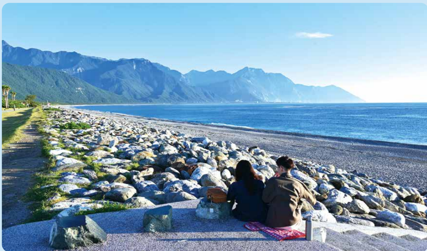
在七星潭可見遊客以鵝卵石堆疊石塔祈願。

此外，花東的海景也十分迷人，熱門的打卡點七星潭別有風情，這裡雖然稱為「潭」，但其實是一片