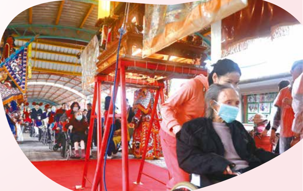
馬蘭榮家辦理神明遠境開元宵活動，榮家護理師推薦護理住民鑽神轎祈福。(圖／馬蘭榮家)

彰化榮家：邀請久榮團演出，猜燈謎活動原規劃二十五題，內容涵蓋成語聯想、生活常識與趣味謎語，只見長輩們踴躍舉手，答題聲此起彼落，主辦單位臨時加碼至四十題，讓長輩更展身手。