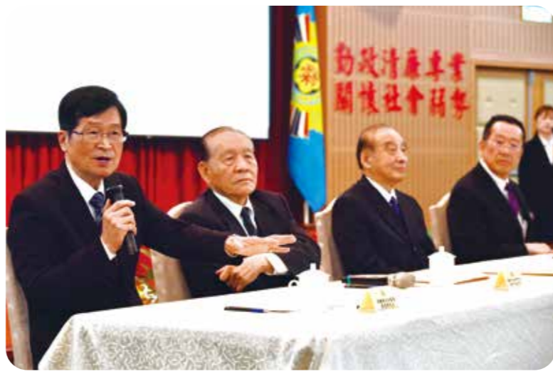
愛國教育北區座談由一級上將霍守業(左二)、林鎮夷(左三)及輔導會主委嚴德發(左一)、國防部長顧立雄(左四)與退伍軍人社團交流。

【本刊訊】輔導會二月二十六日舉辦「一五五年愛國教育北區座談」，邀請兩位一級上將霍守業、林鎮夷及國防部長顧立雄，與北區退軍人社團座談，呼籲支持為期八年、總規模一、二五兆元的國防特別預算，強化整體防衛韌性，確保國家安全。 座談由輔導會主任委員嚴德發、國防部長顧立雄共同主持，國防安全研究院董事長霍守業、戰略顧問林鎮夷、參謀總長梅家樹等貴賓出席；另有中央軍學院校友總會、退伍軍人協會、八二三戰役戰友總會等二十七個退伍軍人社團，以及臺北市、新北市四十一個地區性後備輔導中心等單位代表參與座談，輔導會則有副主任委員陳進廣、主任秘書楊長政及各處會主管出席。 會中首先觀賞影片「守護家園、厚植國防防衛韌性」，呈現榮民過去守護家園的歷史背景，以及當前投資國防的重要性。接著由臺北市榮服處處長黃仁報告「服務照顧工作概況」，強調輔導會將持續秉持「崇功報勳」精神，讓榮民（眷）的照顧更綿密、服務更貼切。續由參謀總長梅家樹引言、國防部戰略規劃司長黃文啟中將提出「守護國家、國軍持續前行」專案簡報，說明國防部加強防衛韌性的具體作為。 戰略顧問林鎮夷發言時，呼籲「全力