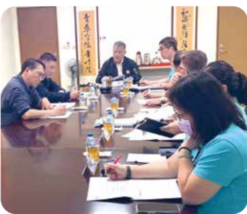
吳副主委(中)視導預辦工程地點後，與榮家同仁開會討論。

【本刊訊】輔導會副主任委員吳志揚三月九日偕同副處長賀華等前往屏東榮家，視導二一六年預辦工程規劃情形，由榮家主任李泰強全程陪同，並進行相關簡報與現地說明。 吳副主委首先前往榮家榮靈祠，向前輩牌位上香，表達對榮民先賢奉獻國家與社會的敬意。隨後前往工程預定地點點勘，了解各項設施改善與環境優化規劃，並就工程推動細節提出指導。 吳副主委表示，榮家肩負照顧榮民長輩的重要使命，各項工程建設與環境改善，都是為了提供更安全、舒適與友善的生活空間，期勉榮家在工程規劃與執行過程中，務必兼顧安全、品質與效率，確保如期如質完成。 榮家主任李泰強表示，屏東榮家將依據指導意見持續精進工程規劃與執行作業，落實各項照顧設施改善。 此次視導除展現輔導會對榮家建設與照顧品質的重視，也為未來工程推動提供具體指引，盼透過完善設施與環境改善，提升榮民長輩的生活品質與照顧服務。