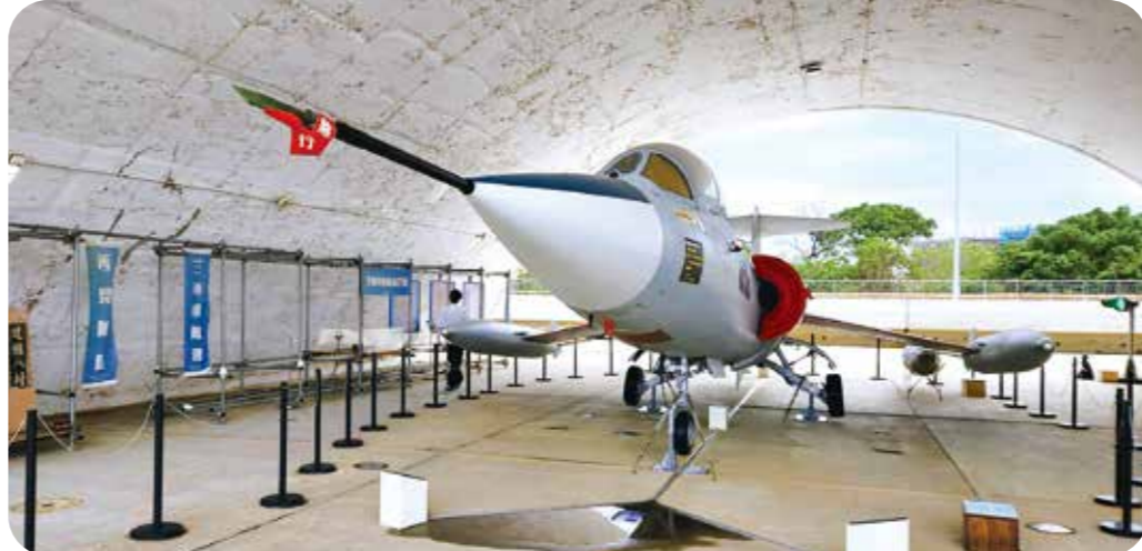
展示在一號機庫內的F-104G戰鬥教練機。

到村口的八號水塘去取水，「八號」便成了早期建國八村的暱稱。 算起來，二老在建國八村不過也住了兩年。民國五十年老姊出生時，一家四口已經搬到新竹的實踐新村。 民國五十九年，我上小一那一年，二老心心念念要回「八號」去訪友，計畫終於付諸實行。當時的拜年過程，我已沒什麼印象，不過對於建國八村倒還是殘存幾許模糊記憶。 其一是重建後的眷村，長相和我住