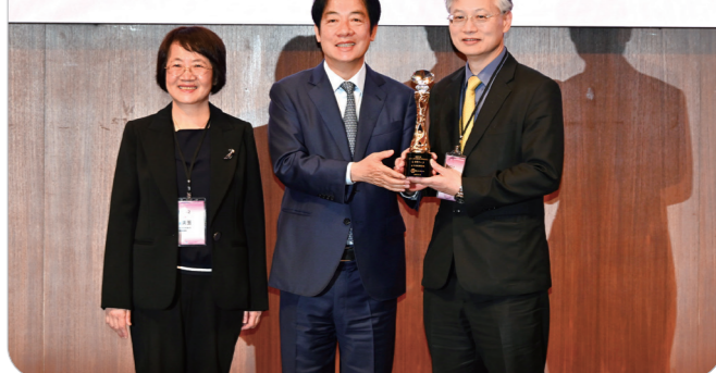
賴清德總統(中)頒發予臺中榮總院長傅雲慶(右)。