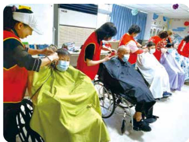
臺南市理燙髮美容職業工會的專業美髮師，為佳里榮家長輩義剪頭髮。

【連線報導】春意漸濃、暖陽和煦，各地榮家近日紛紛結合民間資源與專業團體，舉辦溫馨的愛心義剪活動，不僅提供免費理髮服務，更透過按摩、音樂表演等，讓長輩在春日中煥然一新，感受來自社會各界的溫暖與關懷。