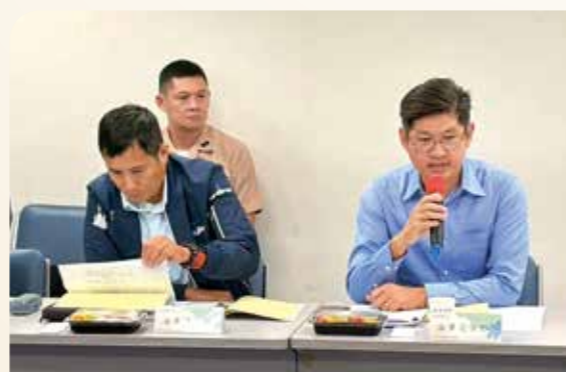
海軍司令部後勤專家參與驗證會議。

預期平臺的上線將帶來顯著的效益，首先是「縮短待業時間」，官兵退伍前即可透過平臺檢視個人職能，進行針對性的在職進修。其次是「優化媒合流程」，系統將建立軍職人才資料庫，使輔導會能依據國防、戰略或創新產業之需求，快速篩選並媒合適當人才。最重要的是引導官兵在營期間即建立職涯願景，掌握職場脈動，將軍中訓練與民間發展連結，有效延緩軍軍的人力資源價值，順利展開軍業第二春。同時，民間企業亦可透過平臺的精準媒合機制，降低招募成本與用人風險，並依企業需求快速補實關鍵職缺，強化組織競爭力與營運韌性，達到軍民雙贏的人才流動機制，全面提升人才運用效益與國家整體競爭力。