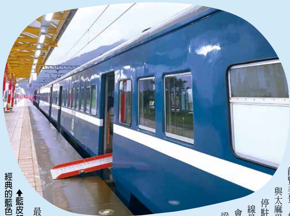
↑藍皮解憂號車身保留了最經典的藍色塗裝。

當 高鐵以時速三百公里將我們在城市間瞬移時，在臺灣的南方，有一條軌道上的火車不趕時間。它開著窗，讓浪花的声音直接拍打在耳膜上，讓太平洋的鹽味細細地滲進皮膚的毛孔，這就是臺灣的「藍皮解憂號」。