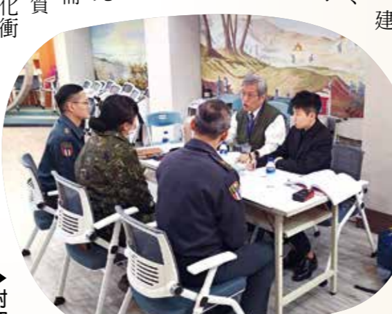
對照表建置團隊至陸軍司令部，訪談現役官兵，建立陸軍專長職能分析報告。

在作業歷程中，最大的挑戰莫過於「政策立場」與「資安防護」的權衡。國防部曾憂心轉銜機制可能激發官兵退離，影響「長留久用」。輔導會對此提出實證，說明影響留營的主因為生涯規劃或任務頻繁，完善的退後職涯規劃反而能讓官兵在營安心服役，是增加募兵制誘因的關鍵。另針對資安，國防部高度關注現役官兵資料安全，經過多次協商研討，採取「國防部提供資料不涉及機密」、「系統依照數位發展部規範列為「高」級別防護」與「透過加密技術傳輸資料」等方法，確保資料在無涉機敏的前提下安全運用。