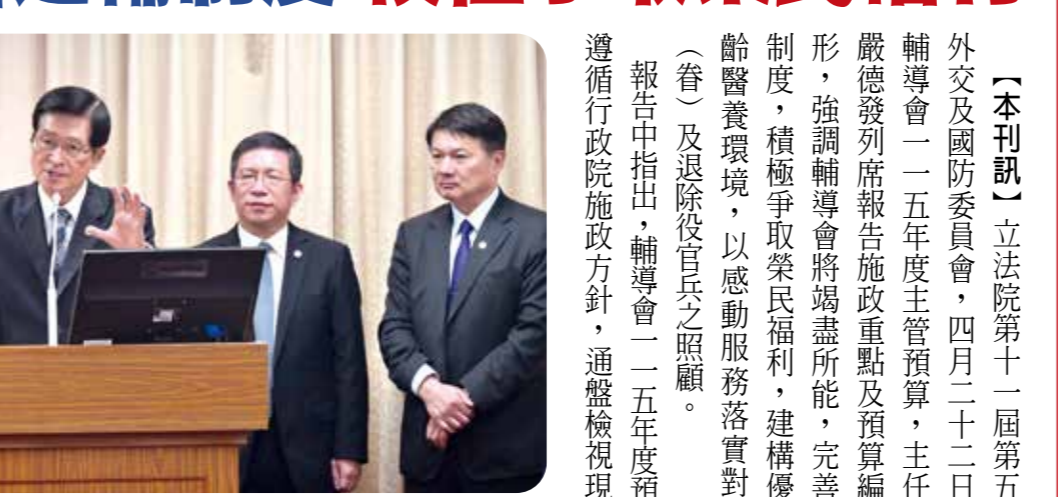
主委嚴德發表示，輔導會將建構優質高齡養老環境，落實對榮民(眷)及退除役官兵之照顧。

【本刊訊】立法院第十一屆第五會期外交及國防委員會，四月二十二日審查輔導會一一五年度主管預算，主任委員嚴德發列席報告施政重點及預算編列情形，強調輔導會將竭盡所能，完善退輔制度，積極爭取榮民福利，建構優質高齡養老環境，以感動服務落實對榮民(眷)及退除役官兵之照顧。