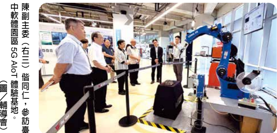
中軟體園區 5G AIoT 體驗基地。

【本刊訊】輔導會副主委陳副主委（右三）偕同仁，參訪臺中軟體園區 5G AIoT 體驗基地。 輔導會副主委陳副主委於四月二十九日率領同仁參訪臺中軟體園區 5G AIoT 體驗基地。陳副主委表示，隨著產業應用進入自動化與智能化，退役官兵經過良好的訓練，具備執行力與抗壓性，若能結合 5G 與