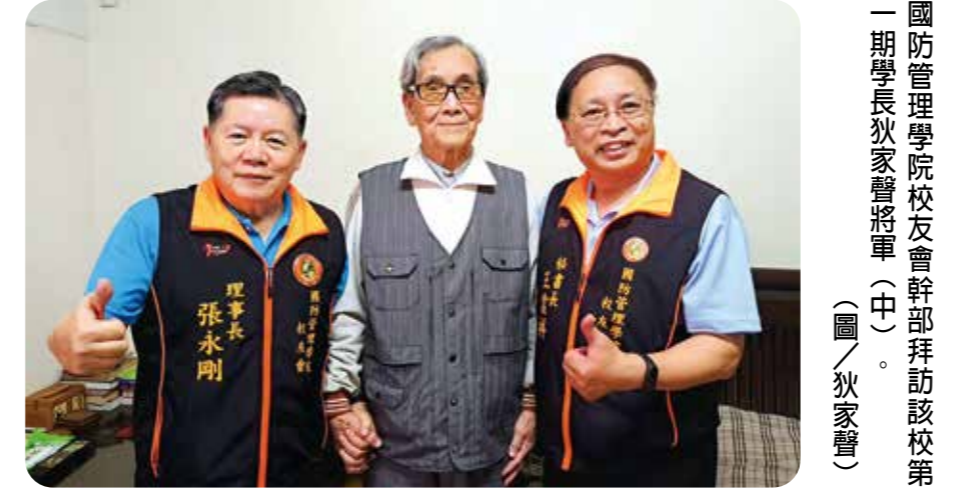
國防管理學院校友會幹部拜訪該校第一期學長狄家聲將軍(中)。