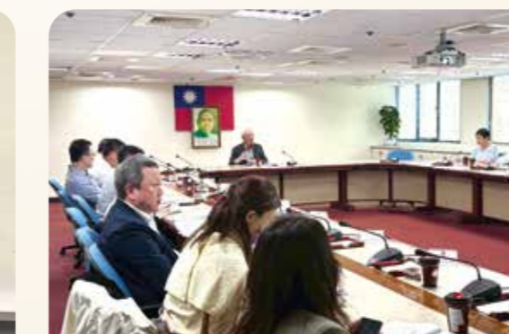
軍民專長轉銜涉及跨部會業務，輔導會多次與各部會密切溝通。

完善配套措施 迎接此項從無到有的就業服務新里程，使現役官兵、退役袍澤廣為周知，並善加利用，必須加大力度宣導。輔導會積極與國防部政戰局接洽合作，未來將於「莒園地電視教學」製作專輯，讓現役官兵在退伍前六個月至一年即能掌握就業補助、產學合作、推甄入學及職訓進修等權益。同時，輔導會已與CPI及三二二人力銀行合作，於人力銀行網站設置退除役官兵專區，持續宣導各項就業與輔導措施，並將進一步納入「軍民專長轉銜運用平臺」資訊，提升媒合效能與使用率，且持續結合青年日報及軍聞社等軍方媒體資源，擴大政策觸及範圍，強化資訊傳遞效益。