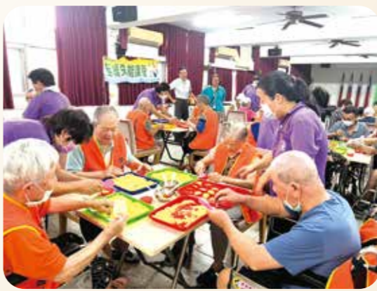
榮家工作人員協助長輩們專注製作綠豆糕。