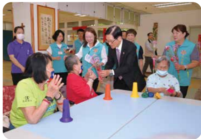
輔導會主委嚴德發贈康乃馨花束予榮家住民，祝福母親節快樂。

【本刊訊】五月八日，輔導會主任委員嚴德發偕同長陳相寶等人，前往白河榮家視導，深入了解住民生活照顧情形及各項服務推動成果，並慰勉第一線工作人員的辛勞。時值母親節前，主委特地致贈榮家女性住民康乃馨，祝賀佳節愉快。 主任委員一行抵達白河榮家後，首先前往榮家禮堂，場面莊嚴肅穆，充分表達對榮民前輩守護國家之敬意。其後，主委於會議室聽取榮家業務簡報，並頒發慰勉金，高度肯定榮家同仁在住民照顧及服務工作上的用心與付出。 主任委員致詞表示，榮民前輩一生奉獻國家，輔導會始終秉持「視榮民如親」的精神，持續精進各項照顧服務，讓長輩們在榮家都能感受到家的溫暖與尊嚴。他肯定白河榮家積極導入智慧科技照顧，及同仁長期以來的用心付出，並強調照顧住民不僅是責任，更是一份使命與情感連結。時值母親節前夕，他特別向女性長輩獻上誠摯祝福，祝願大家身體健康、平安喜樂，天天都能感受到溫馨關懷。 隨後主委走訪家區，了解松柏樓護理區住民的生活起居與照顧現況，並參觀智慧床墊的實際運用情形，對榮家積極導入科技照顧、提升服務品質之作為表示肯定。 迎接母親節，主委特別準備了康乃馨花束，親手贈送給榮家女性住民長輩，這份突如其來的驚喜與溫暖，讓榮家長輩們倍感欣慰，笑逐顏開。 白河榮家主任姚辰蕙表示，未來將持續精進照顧品質，結合專業服務與智慧科技，營造安全、安心且具尊嚴的照顧環境，讓榮家住民長輩獲得更完善的照顧。