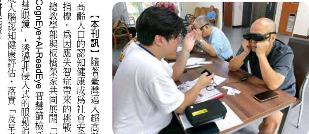
北榮團隊讓板橋榮家長輩(右)配戴「智慧眼鏡」，透過眼動追蹤技術，在幾分鐘內完成大腦認知健康評估。